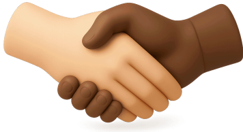
Trabajo en equipo