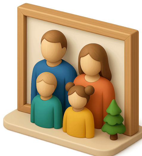
Familias costarricenses actuales