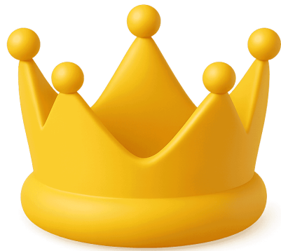
Símbolo del poder colonial

"Si pudiéramos viajar en el tiempo y comparar la justicia en la colonia con la justicia actual, ¿qué descubriríamos y cómo podríamos mejorar nuestra sociedad?"